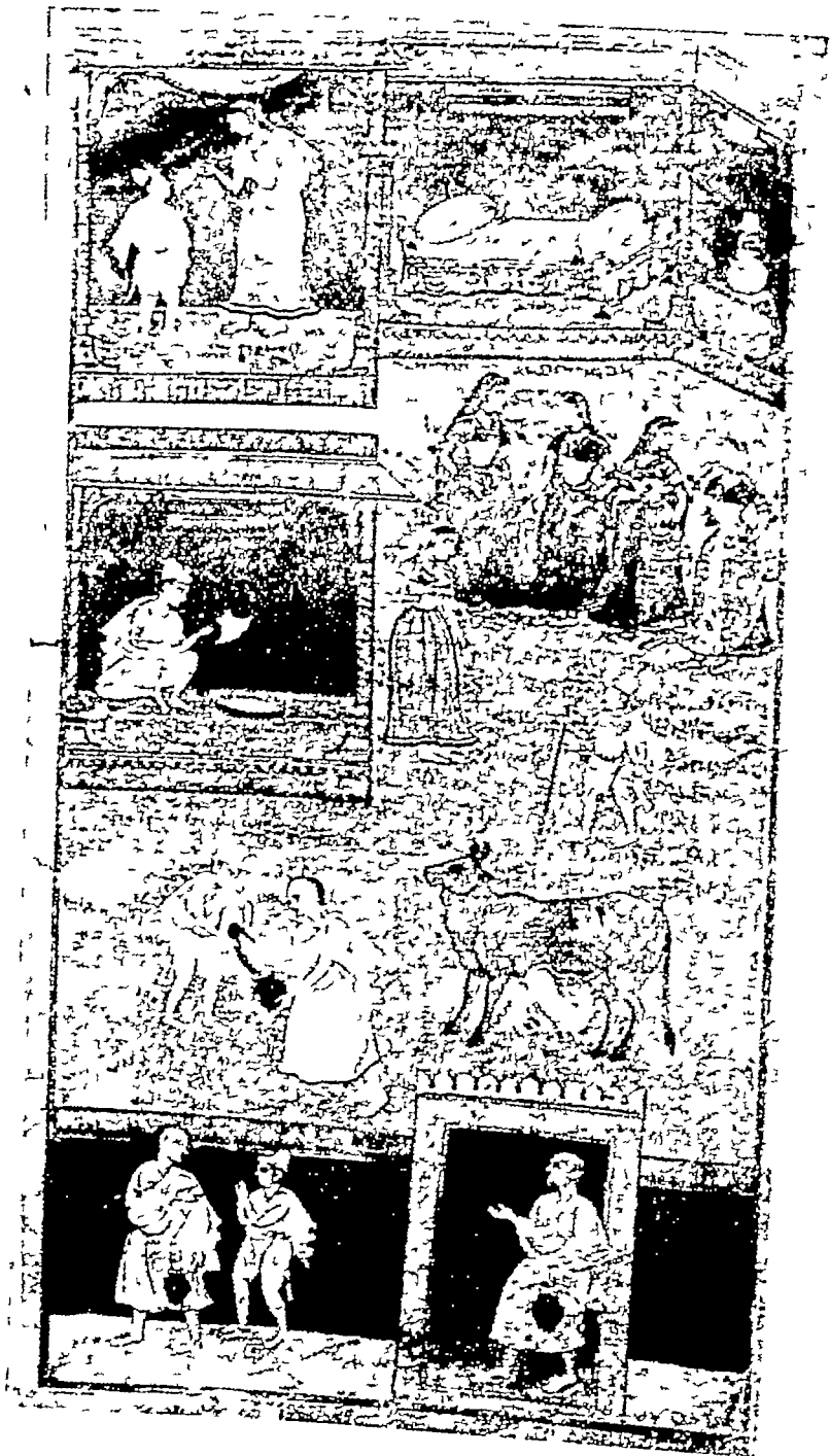
शालिभद्र का पूर्वभव में मुनिदान